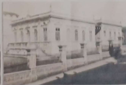
Gabinete de Leitura Itapevense - Anos 40/50