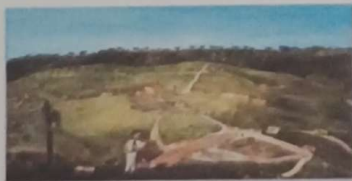
TELA DE JEAN BAPTISTE DEBRET, reproduzindo Itapeva da Faxina em 1827

Fez-se grande... foi arte retratada ! Na viagem pitoresca de Debret, Enquanto os tropeiros eram estrada,